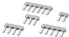
Abbildung zeigt eine Kombination aus den Varianten, EBP 2-5, EBP 3-5, EBP 4-5, EBP 5-5, EBP 6-5

Einlegebrücke, vollisoliert, für Steckverbinder im 5,0 bzw. 5,08 mm Raster, Polzahl: 3