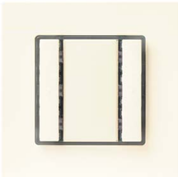
GAMMA INSTABUS TASTER 1-FACH UP 221/2 DELTA I-SYSTEM TITANWEISS